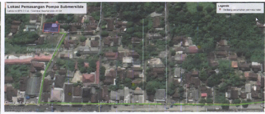
Situasi lahan rencana lokasi Pompa Booster