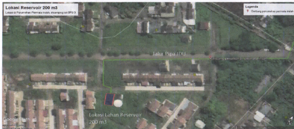
Situasi lahan rencana lokasi Reservoir