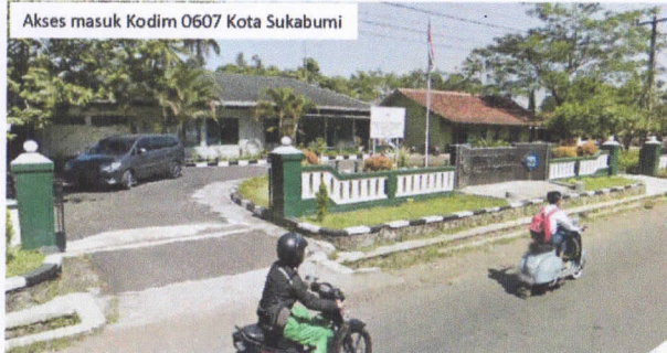
Akses masuk Kodim 0607 Kota Sukabumi