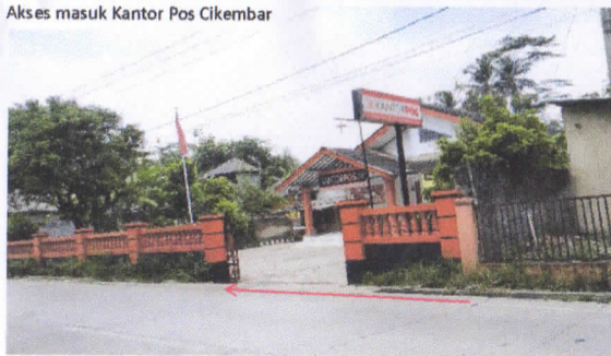
Akses masuk Kantor Pos Cikembar